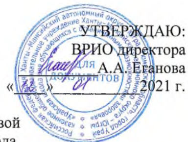
График питания обучающихся в столовой на II полугодие 2020-2021 учебного года

КОУ «Урайская школа для обучающихся с ограниченными возможностями здоровья»